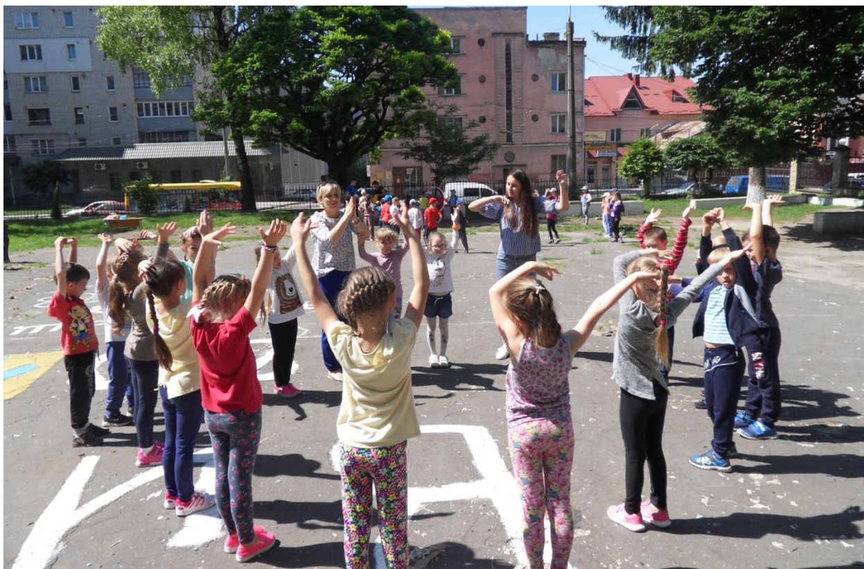
Руханки на свіжому повітрі