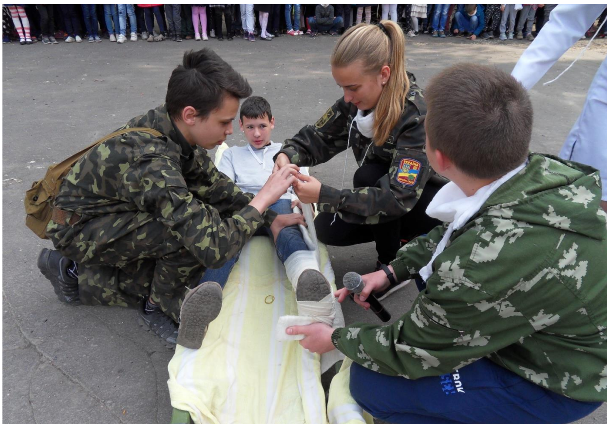
День цивільного захисту