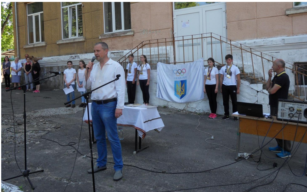
Відкриття малих олімпійських ігор