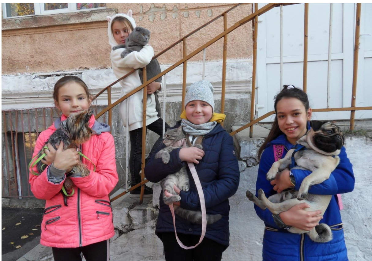
Виставка домашніх улюбленців