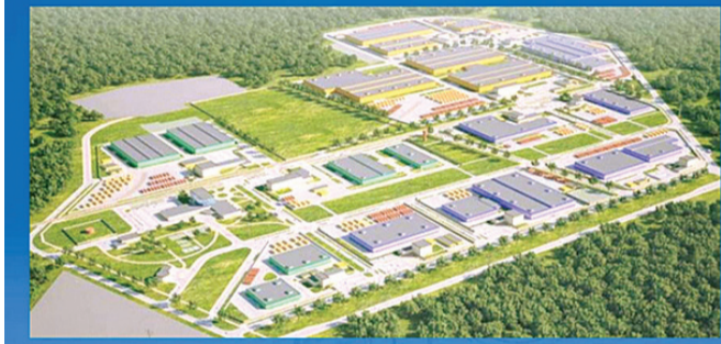
Орієнтовна схема індустріального парку

Протягом звітнього періоду до мене як до депутата виборчого округу №22 Тернопільської міської ради VII скликання надійшло понад 100 письмових та близько 300 усних звернень, 286 осіб прийшло на прийом, надавав необхідні консультації. За моєї участі було проведено понад 30 зборів мешканців будинків мого округу з питань капітальних і поточних ремонтів прибудинкових територій та ремонтів будинків.